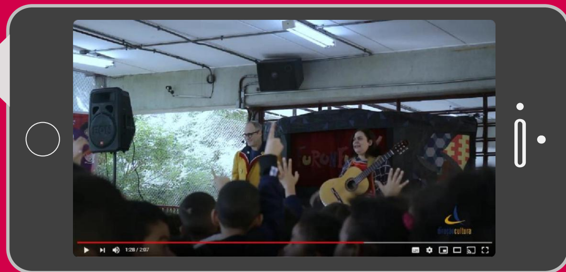
Edição São Paulo