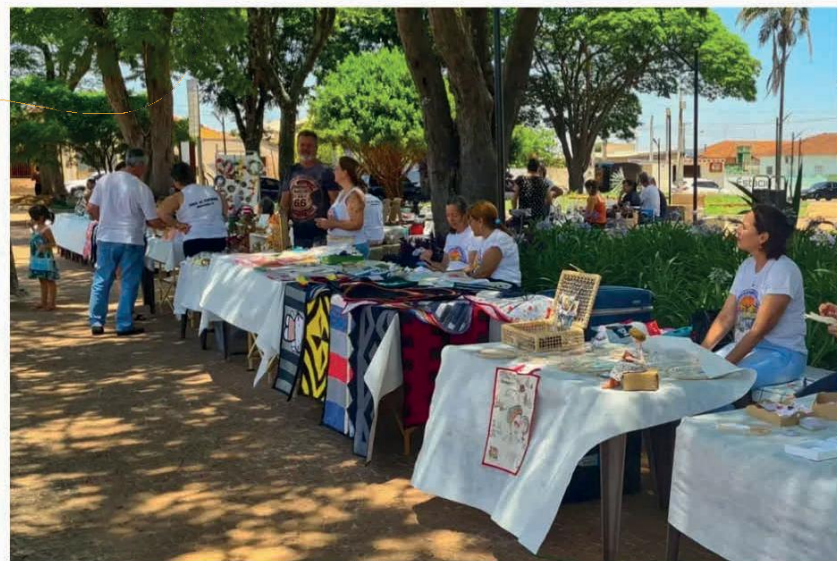
Evento visa apoiar a economia criativa em Brodowski. (MCP)