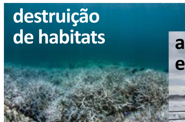
destruição de habitats

impacto das ações humanas sobre o oceano.