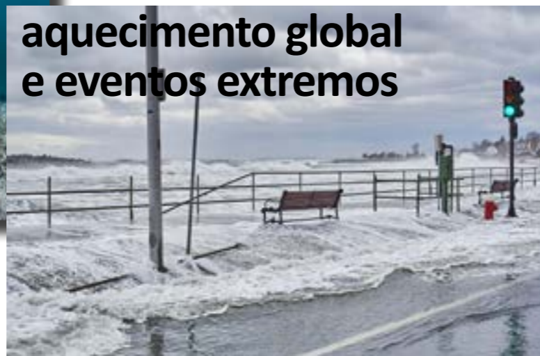
aquecimento global e eventos extremos