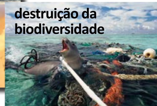
destruição da biodiversidade