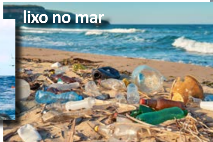
lixo no mar