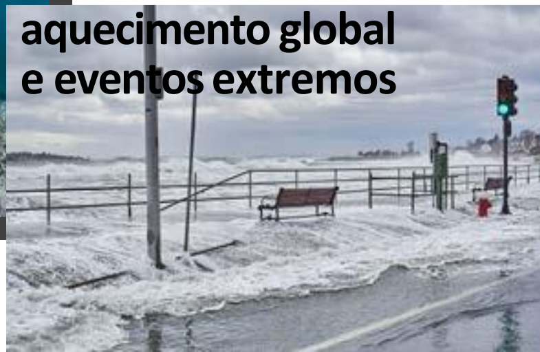
aquecimento global e eventos extremos