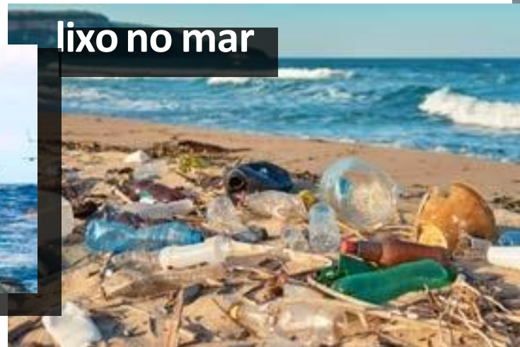
lixo no mar