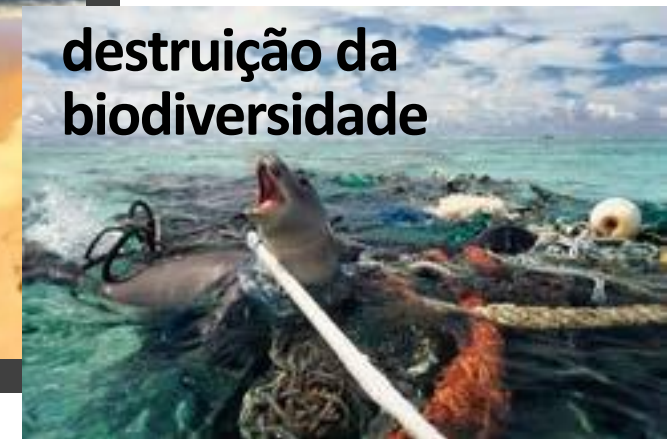
destruição da biodiversidade