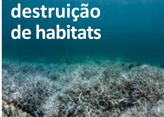
destruição de habitats

impacto das ações humanas sobre o oceano.