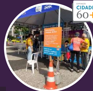
2019 Praia de Copacabana