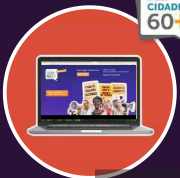
2022 Exposição online