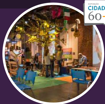
2019 Casa da Ciência UFRJ