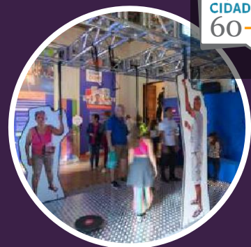
2023 Museu da República

Aborda esse assunto a partir de uma perspectiva interseccional , considerando outros marcadores de diferença – como raça, classe, identidade de gênero, orientação sexual, território, idade .