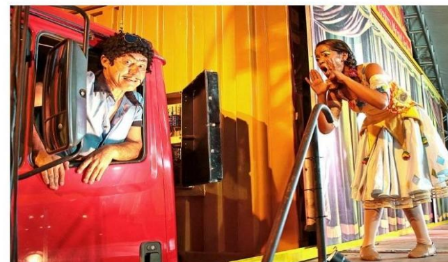
Apresentação do projeto Teatro a Bordo 2018, em Cubatão

Teatro a Bordo anuncia apresentações em comunidades pelas estradas