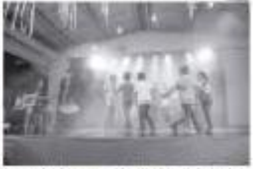
Programa visa integração social e cultural à comunidade Inhayba-Jardim de Inhayba

No local histórico, o grupo aprendeu sobre a história, arte e cultura da comunidade. As oficinas de teatro, dança e música foram realizadas no espaço da comunidade. A iniciativa é promovida pela Direção Cultural e apoiada pela Fibrina.