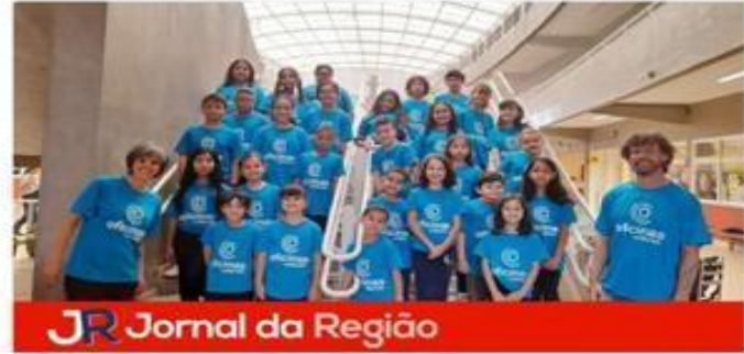
JR Jornal da Região

Teatro - Associação Municipal Governari Brasil Foi inaugurada no ano de 2005 após a formação de uma parceria entre a Associação Cultural, líder mundial na produção de aço, e a Governari Steel Services, empresa líder global na transformação de aço e alumínio no mundo. A Associação Municipal Governari Brasil é um centro de pesquisa de aço, especializado nas pesquisas de desenvolvimento, teste mecânico, metalurgia e ferrugem em aço plano de laminação a quente, a frio e revestido a frio a laser, para desenvolvimento e melhoria dos segmentos automotivo, náutico e esportivo, construção, agrícola, eletrodoméstico e embalagens, entre outros. Hortolândia abriga uma das mais modernas de empresas do Brasil. As outras unidades ficam em Anápolis-PR e Oliveira-MS.