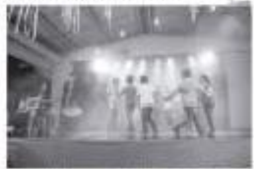
Programa visa integração social e cultural à comunidade infanto-juvenil de Inhayba

No local conhecido como a Moura, no bairro de Inhayba, em Sorocaba, a comunidade recebe as Oficinas Culturais. A iniciativa promove a inclusão social por meio de atividades artísticas gratuitas. O projeto é coordenado pela Direção Cultural e apoiado pela Fibrina.