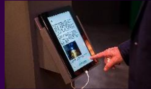
REVISTA DIGITAL tablets