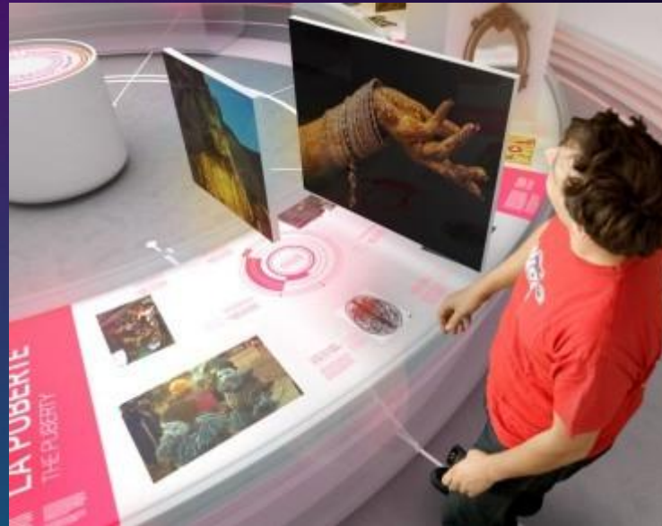
BANCADAS EXPOSITORES telas touchs e tablets