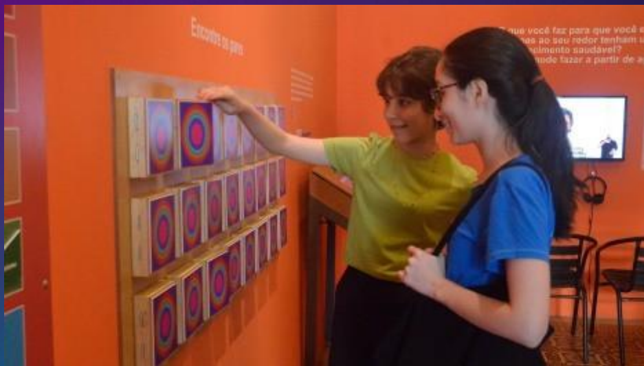
PAINEL PORTINHAS jogo encontra os pares