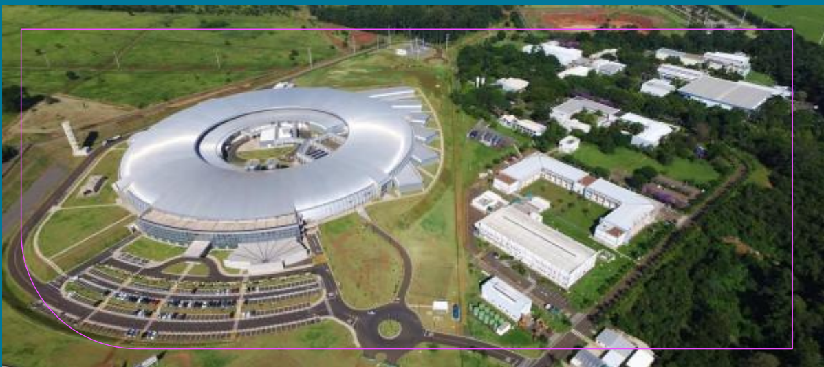
Laboratório Nacional de Luz Síncrotron, Campinas

A exposição busca aproximar o público leigo e escolar do universo estimulante da ciência , tão necessário para a evolução de qualquer sociedade que se pretenda criativa, diversa, inclusiva, educadora e que acima de tudo cultive e preserve sua identidade e sua cultura.