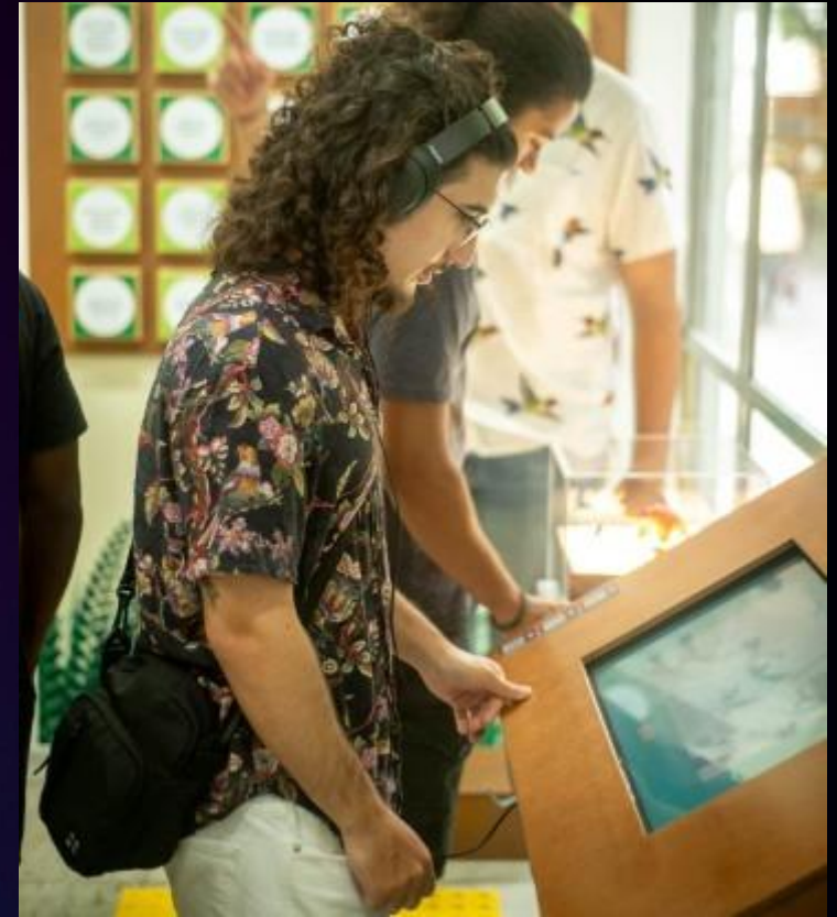
BANCADAS EXPOSITORES tela touch