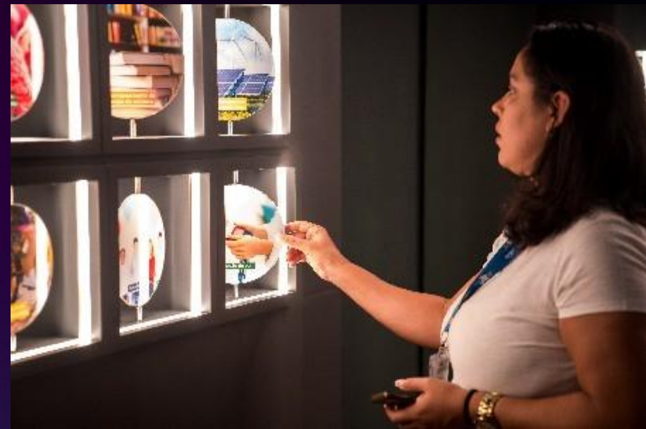
VIRA-VIRA conteúdos para dois lados