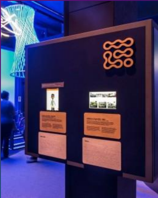
COLUNAS EXPOSITORES tablets