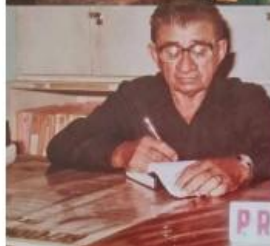
Luta pela Reforma Agrária