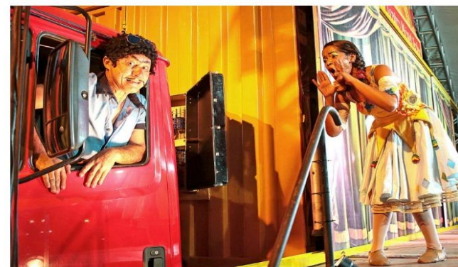
Apresentação do projeto Teatro a Bordo 2018, em Cubatão

Teatro a Bordo anuncia apresentações em comunidades pelas estradas