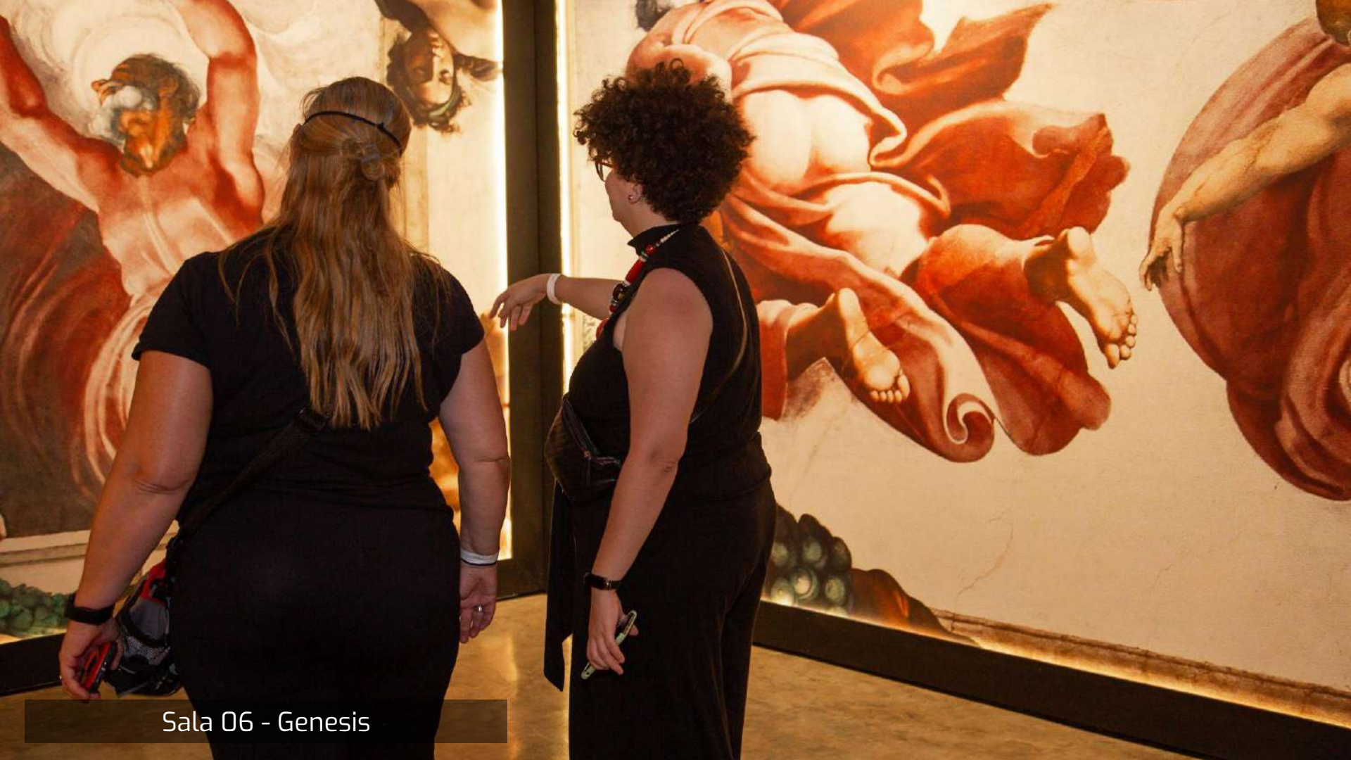
Sala 06 - Genesis