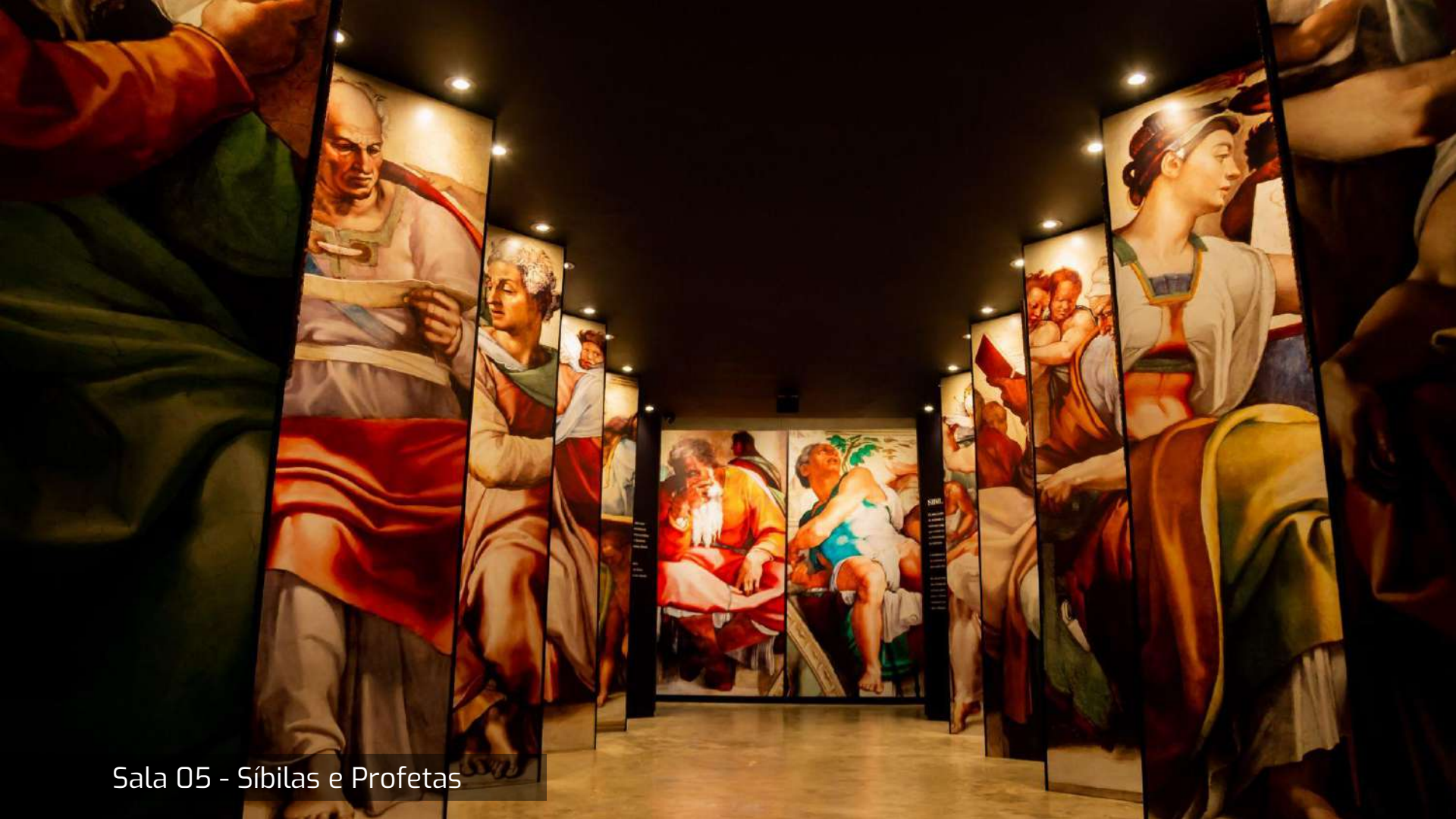
Sala 05 - SÍbilas e Profetas