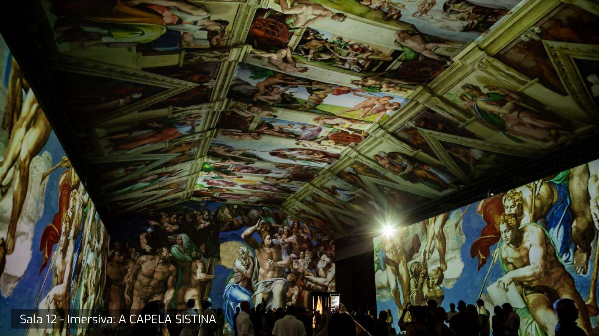
Sala 12 - Imersiva: A CAPELA SISTINA