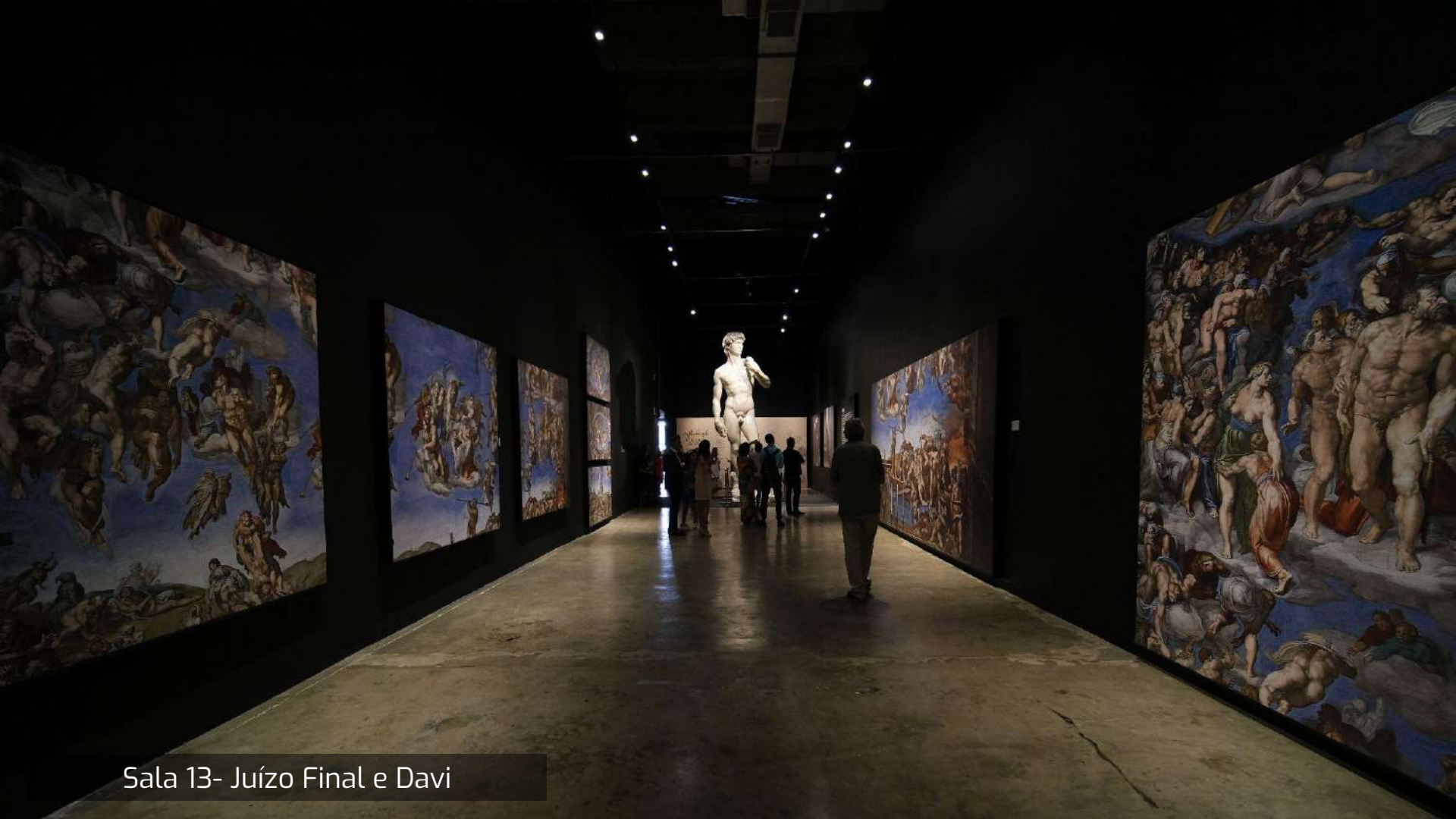
Sala 13- Juízo Final e Davi