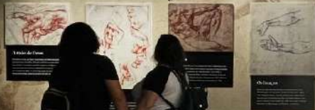
Sala 08 - Dedo de Deus