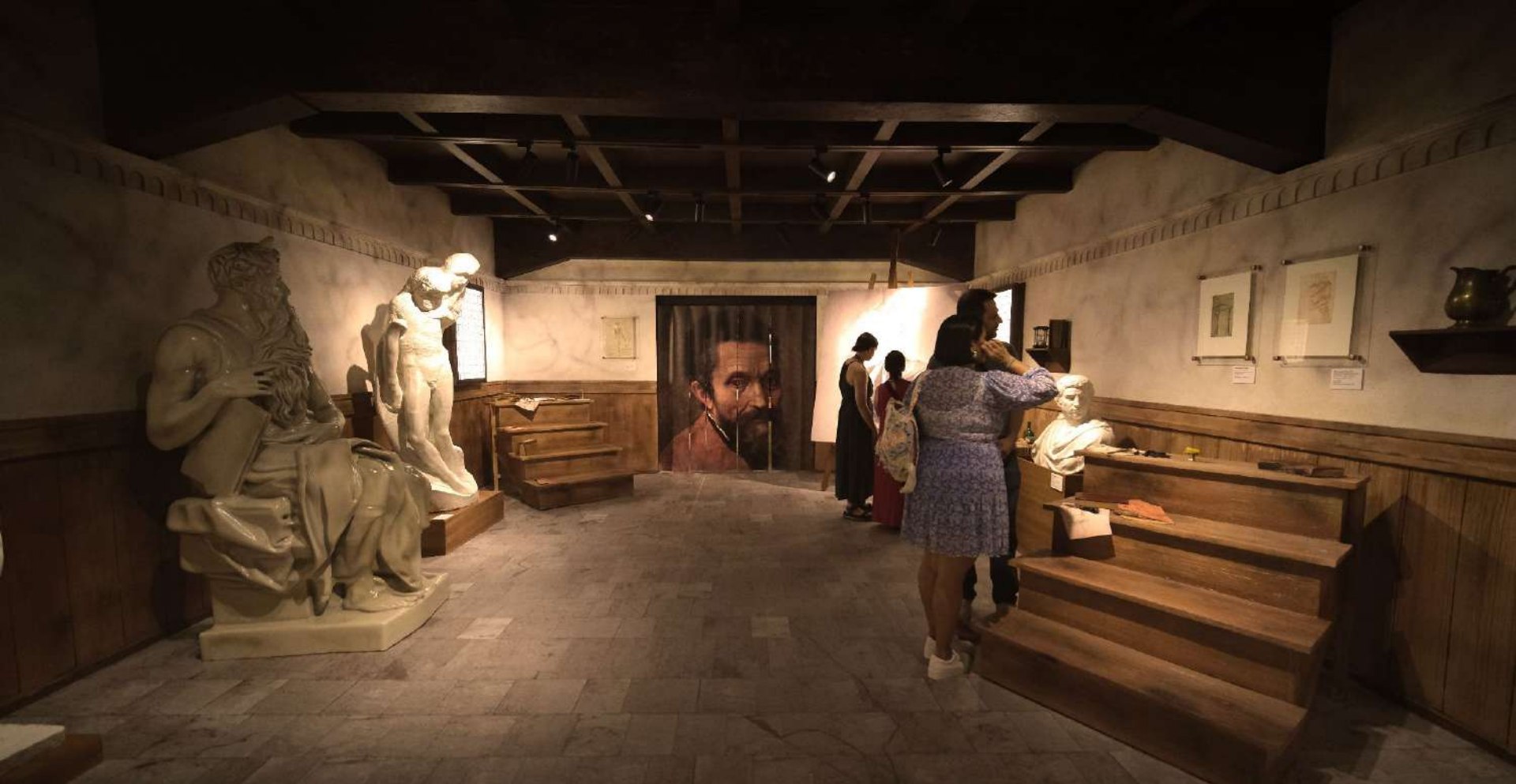
Sala 01 - O Ateliê