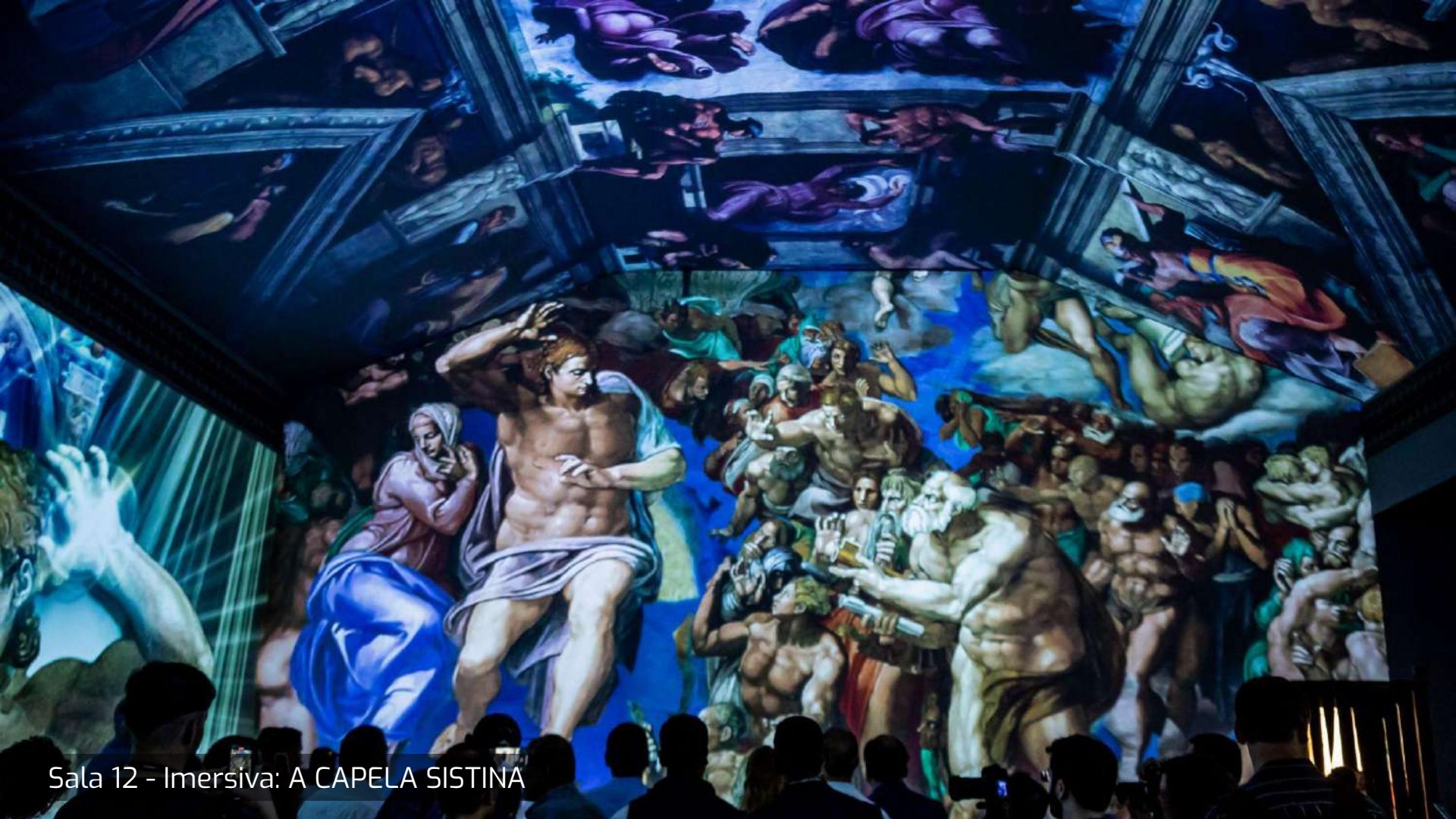
Sala 12 - Imersiva: A CAPELA SISTINA