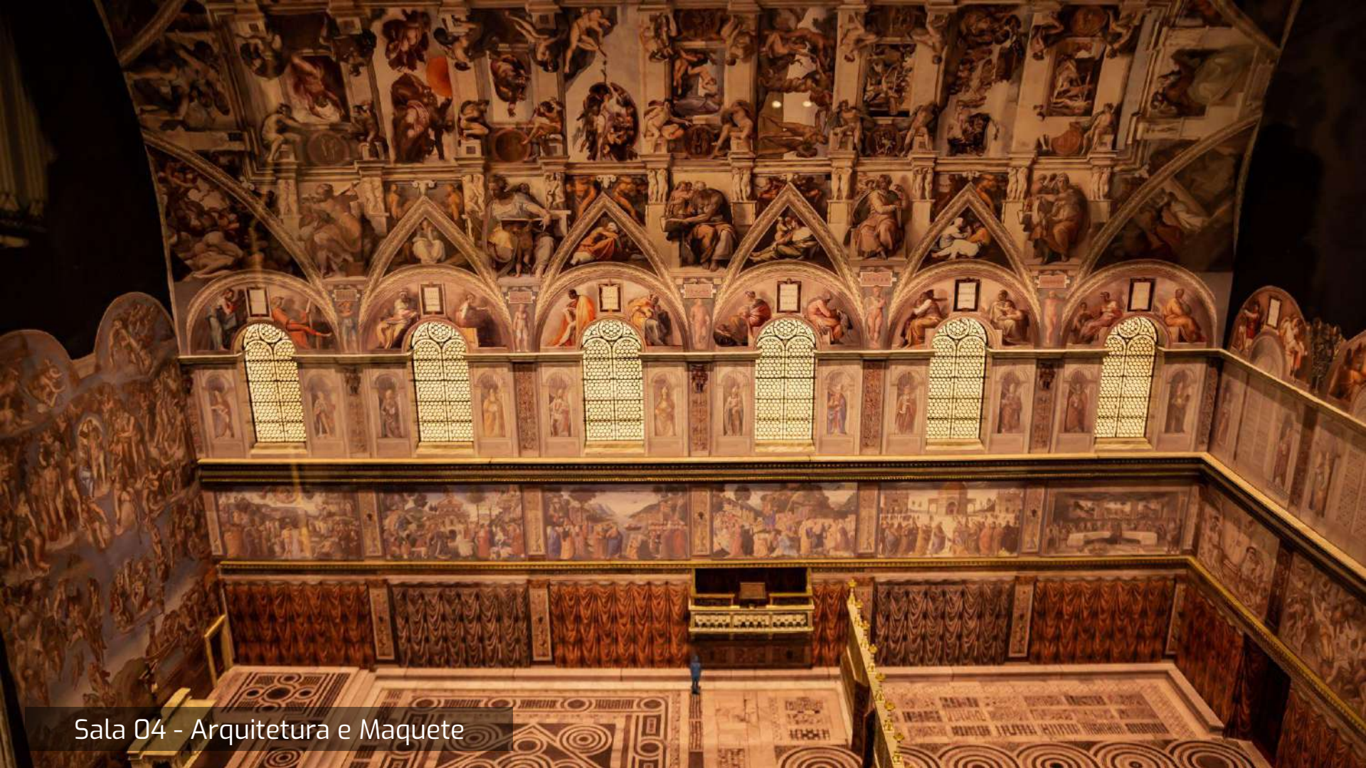
Sala 04 - Architettura e Maquette