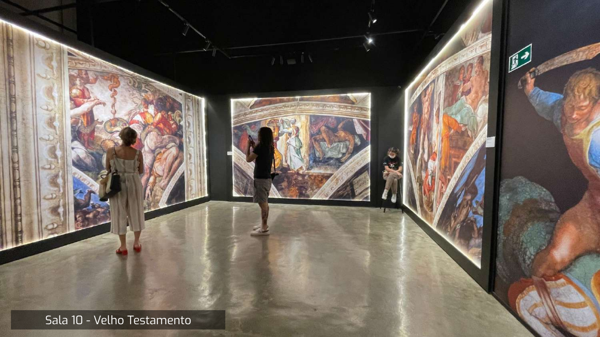
Sala 10 - Velho Testamento