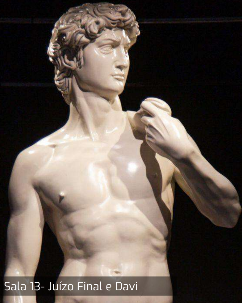
Sala 13- Juízo Final e Davi