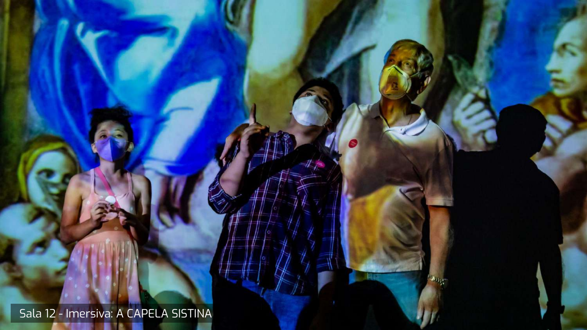
Sala 12 - Imersiva: A CAPELA SISTINA