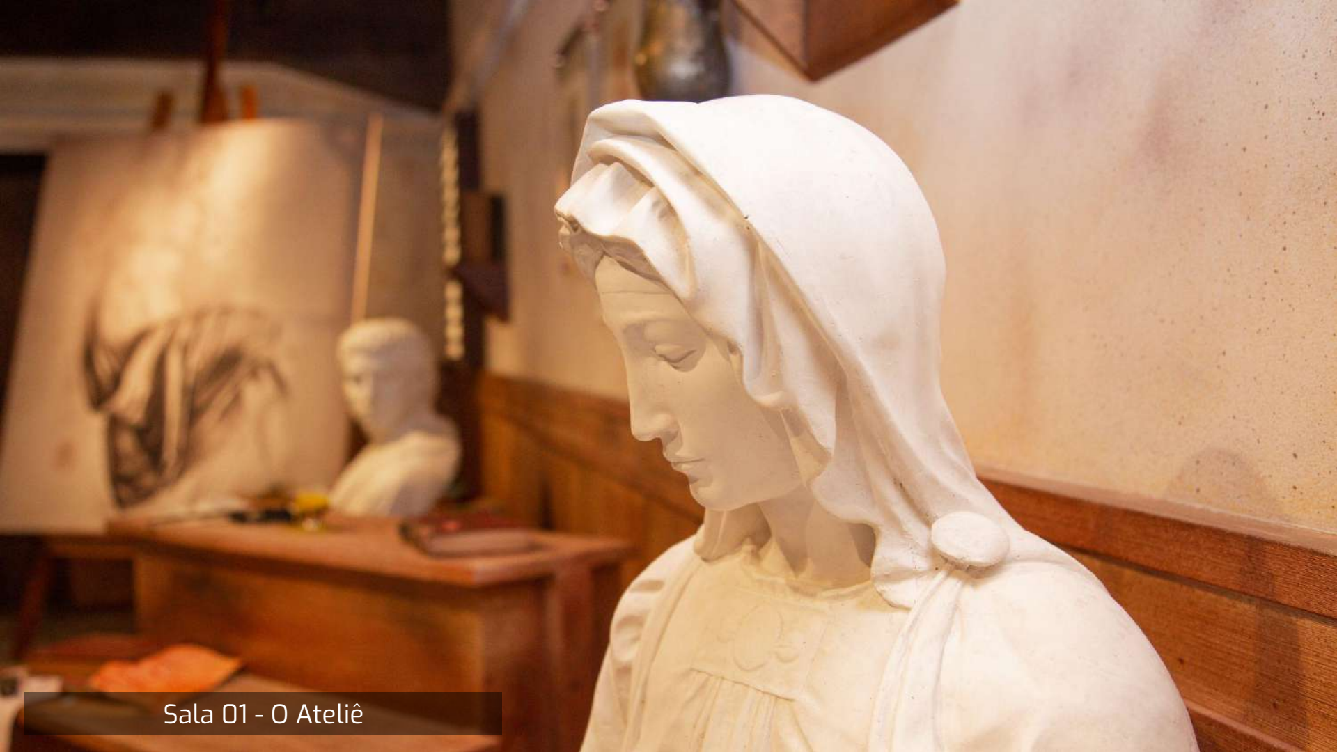
Sala 01 - O Ateliê