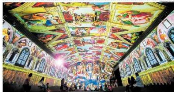
Uma visita à Capela Sistina sem sair de São Paulo

Em parceria com o MIS Experience, a exposição imersiva Michelangelo: O Mestre da Capela Sistina é dividida em 14 salas para o público se sentir dentro das obras. >>