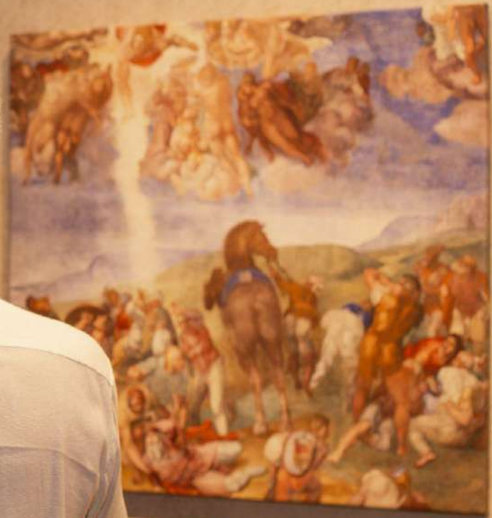
Conversão de Saulo

...nascido por Michelangelo na parede esquerda da Capela do Vaticano. Esta cena figura o momento em que Saul, a caminho de Damasco, é golpeado por uma forte luz vinda do céu, que o cega. Ele é levado aos pés de Jesus Cristo.