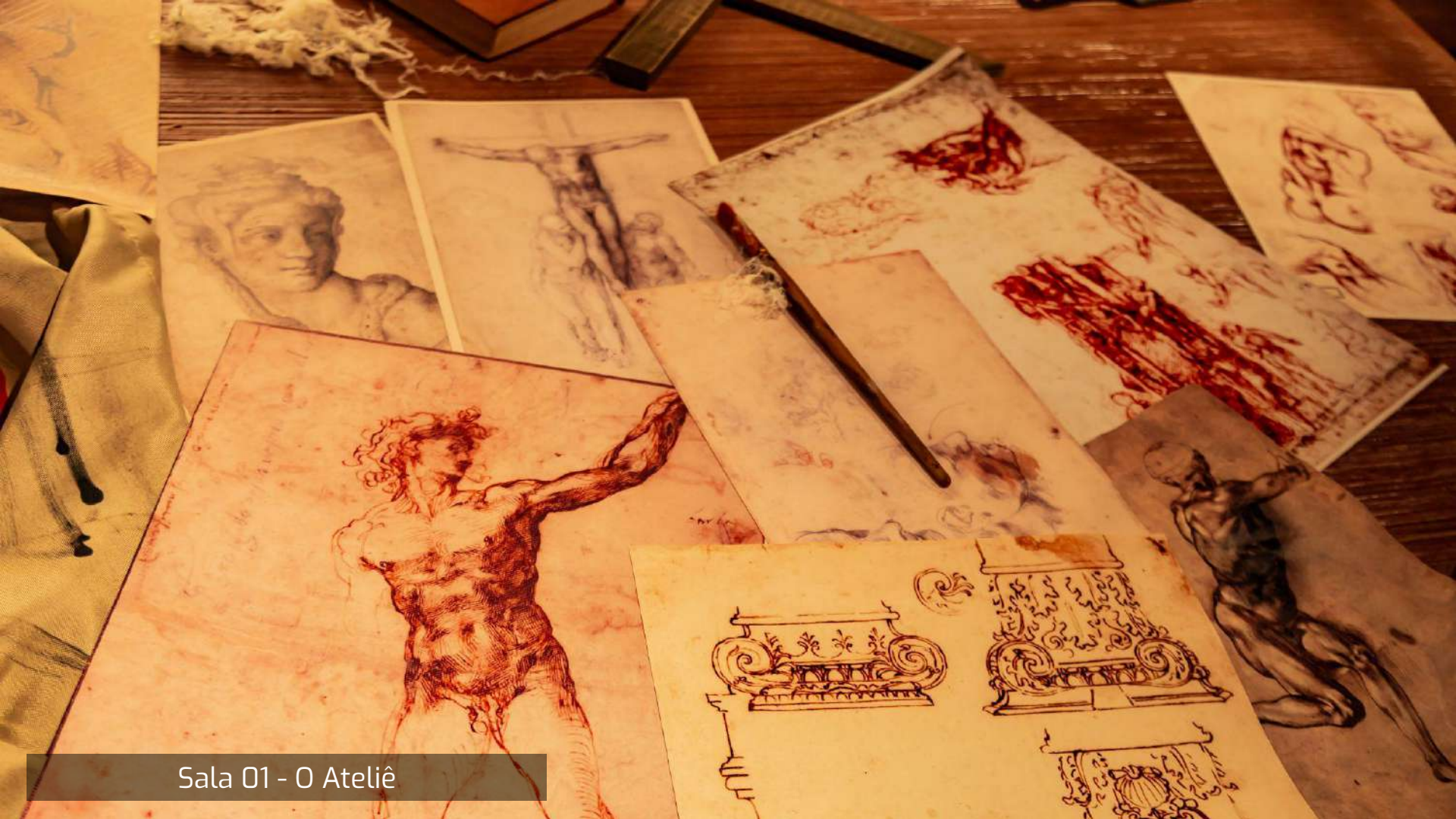
Sala 01 - O Ateliê