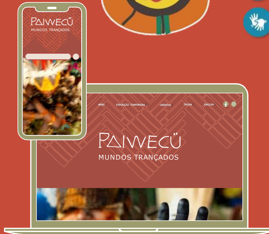
Exemplos de telas