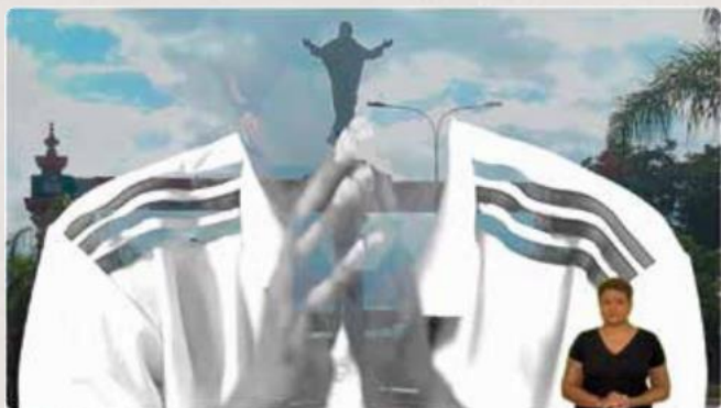
Video experimental - Quatá SP