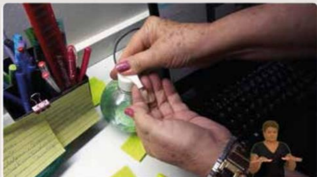
Video experimental - Macatuba SP