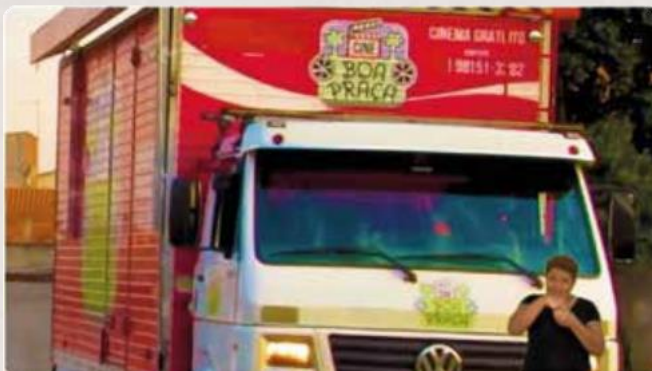
Video experimental - Monte Mor SP