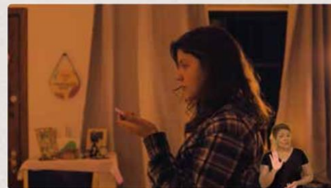
Curta - A persistência (Ponta Grossa)