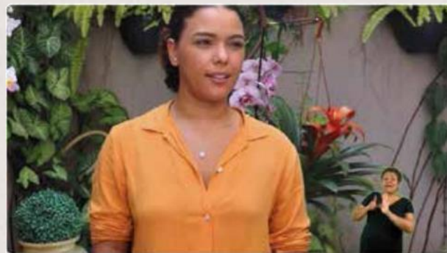
Video experimental - CEU Feitico da Vila