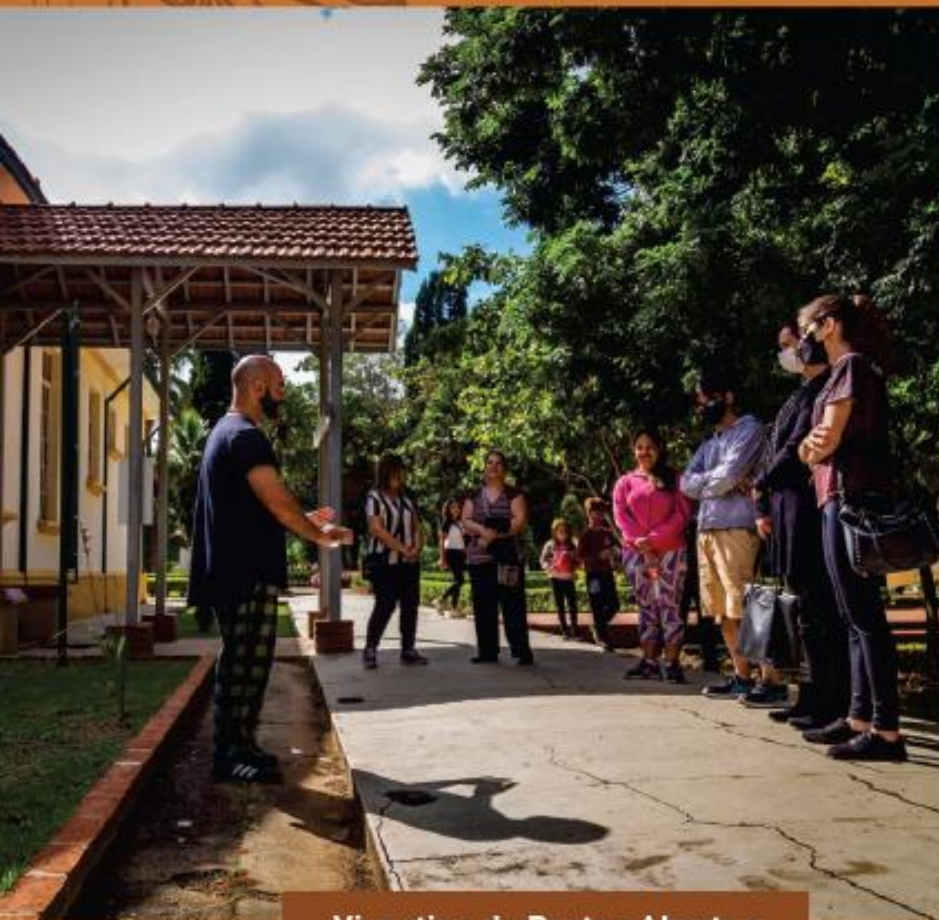
Vicentina de Portas Abertas