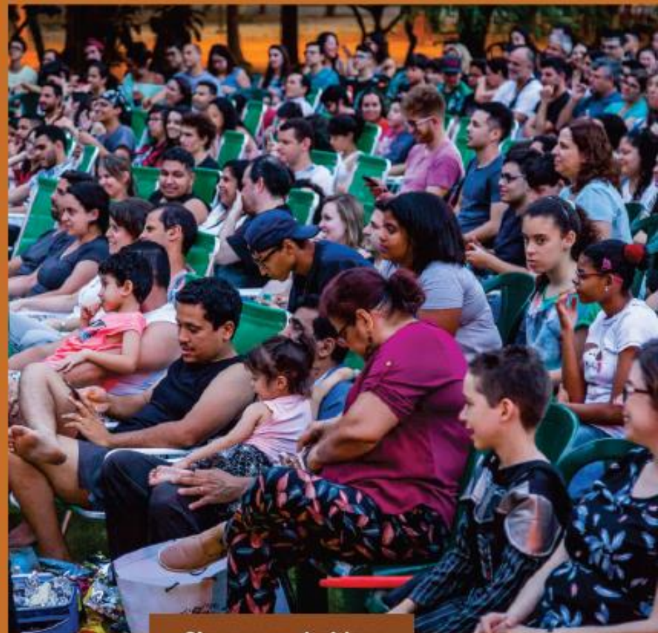
Cinema ao Ar Livre