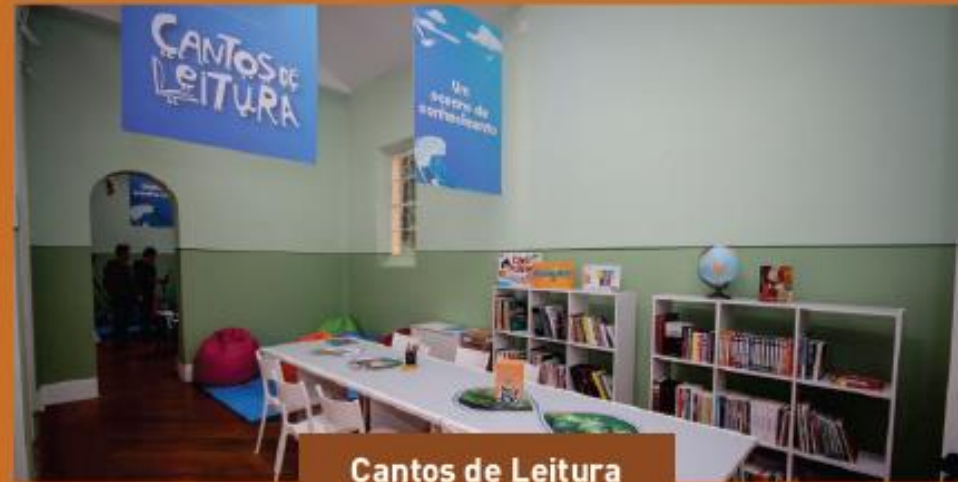
Cantos de Leitura