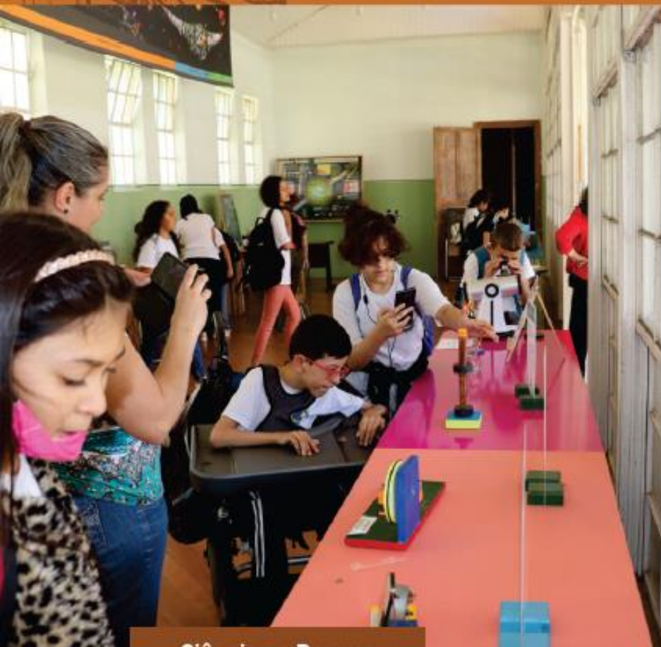
Ciência no Parque