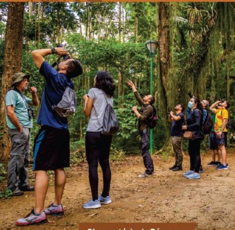
Observatório de Pássaros