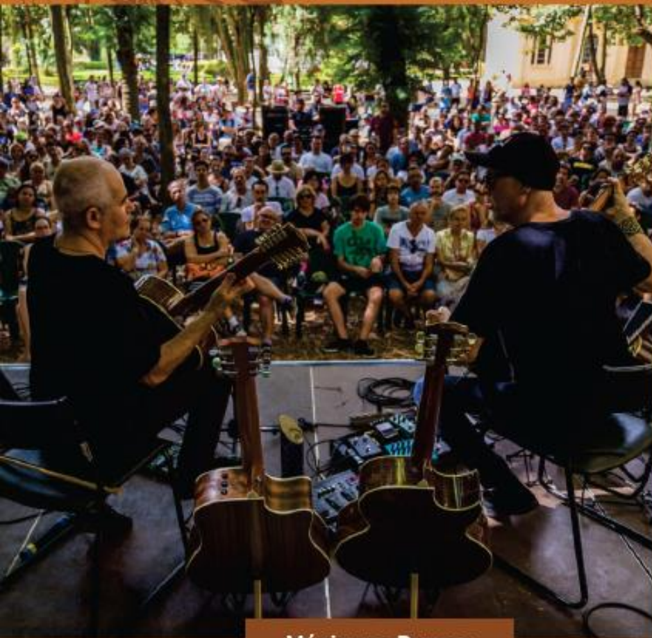
Música no Parque