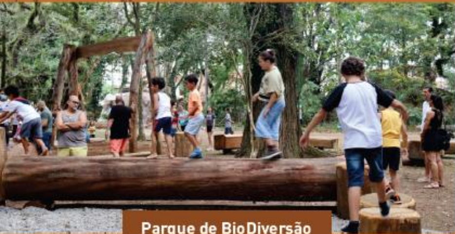
Parque de BioDiversão