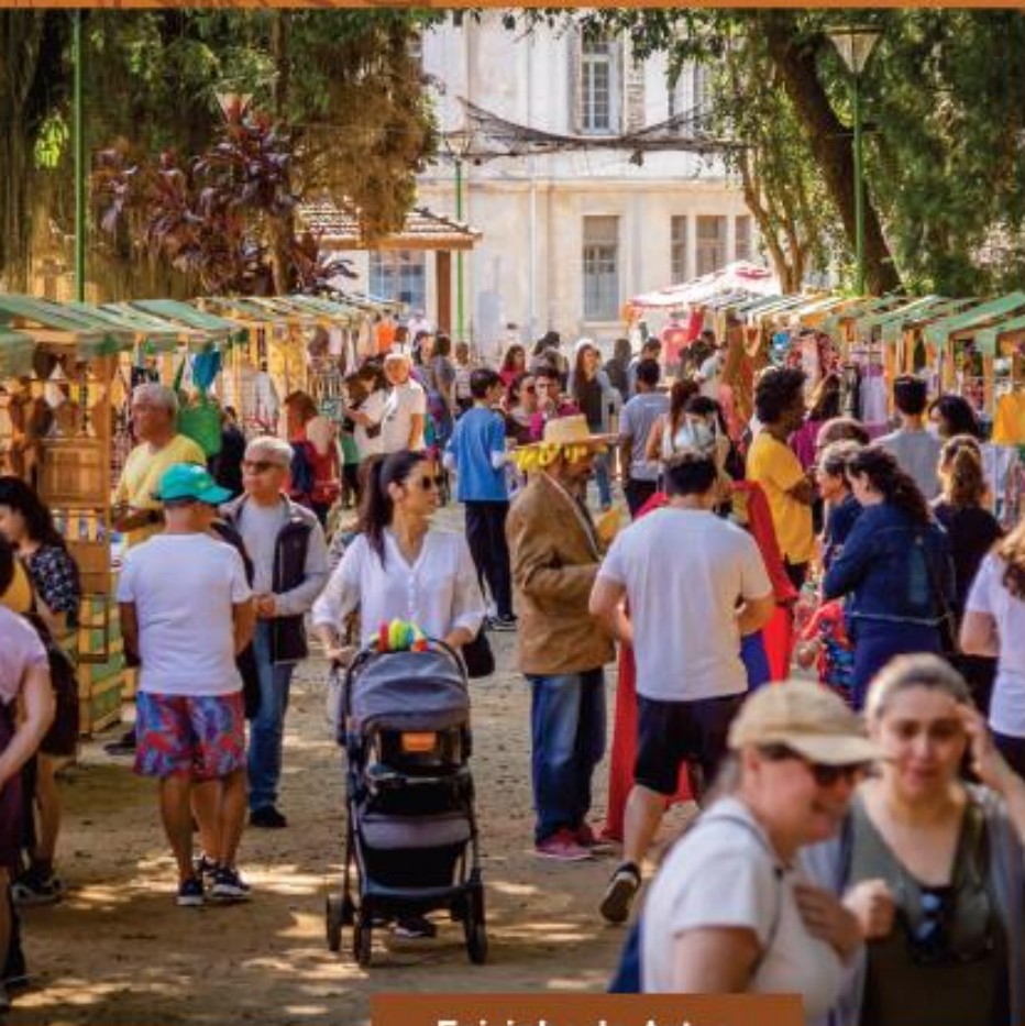
Feirinha de Artes