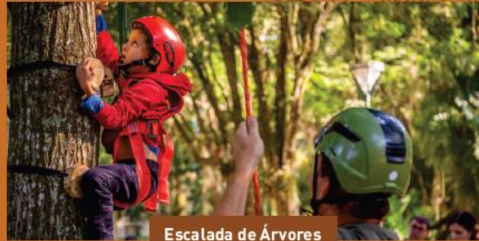
Escalada de Árvores