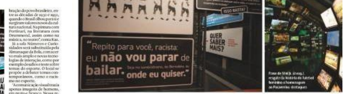
Foto de Vitor Lourenço, jornalista brasileiro, no Museu do Futebol

O Museu do Futebol reabre amanhã com novidades. O local, que estava fechado desde novembro e fica embaixo das arquibancadas do Pacembu, terá sala dedicada a Pelé e mais futebol feminino.