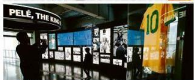
Museu do Futebol reabre com destaque para Pelé e futebol feminino

Diets de cinema, shows, gastronomia e lazer em SP. 'Novica Rebelde', um clássico em SP. Musical com Latina. Musical estreia amanhã.