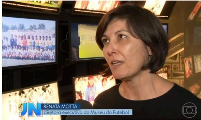
JORNAL NACIONAL - REDE GLOBO

1919 matérias veiculadas R$114,58M retorno de mídia 4.600 matérias em mídia espontânea/ano