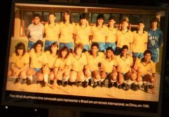
Brasil em competição internacional, primeira convocação para representar o Brasil em um torneio internacional, na China, em 1980.