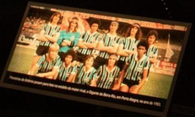
Primeira partida oficial para a seleção brasileira de futebol feminino, vitória sobre a Argentina, em Porto Alegre, no ano de 1983.