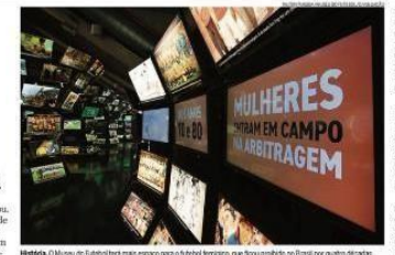
Mulheres foram em campo.

O Museu do Futebol, em São Paulo, será reaberto após um período de fechamento desde novembro. Agora, o acervo de mais de 10 mil peças e a participação feminina no esporte são os destaques da inauguração do museu e da abertura da sala dedicada a Pelé e mais futebol feminino.