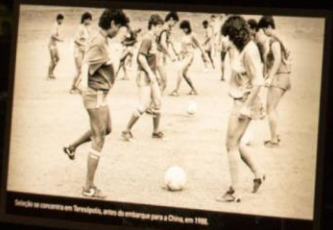
Seleção em competição em Tientsin, antes de embarcar para a China, em 1980.