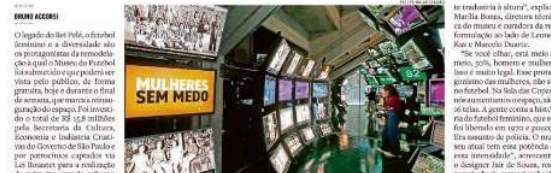
Reformado, museu tem novas áreas que registram a luta das mulheres no mundo do futebol

— Espaço, que volta a funcionar e tem entrada gratuita hoje, amanhã e domingo, recebe investimento de R$ 16 milhões, amplia atenção às mulheres e ao Rei do Futebol