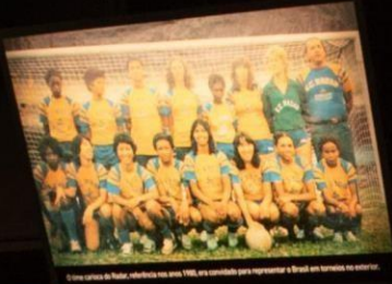
É uma camisa do Real, referência nos anos 1960, era escolhida para representar o Brasil em torneios no exterior.