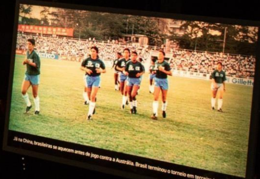
Já na China, brasileiras se aquecem antes de jogo contra a Austrália. Brasil terminou o torneio em terceiro lugar.