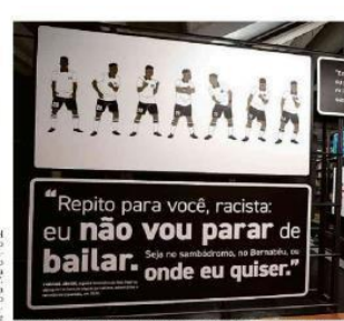
Foto da sala Almanoque da Bola, no Museu do Futebol, em SP

O Museu do Futebol, em São Paulo, será reaberto amanhã com novidades. O local, que estava fechado desde novembro e fica embaixo das arquibancadas do Pacembu, terá sala dedicada a Pelé e mais futebol feminino.