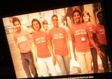
No Rio Paulo nos anos 1960, surgem times de diferentes origens. O do boteiro foi o primeiro.