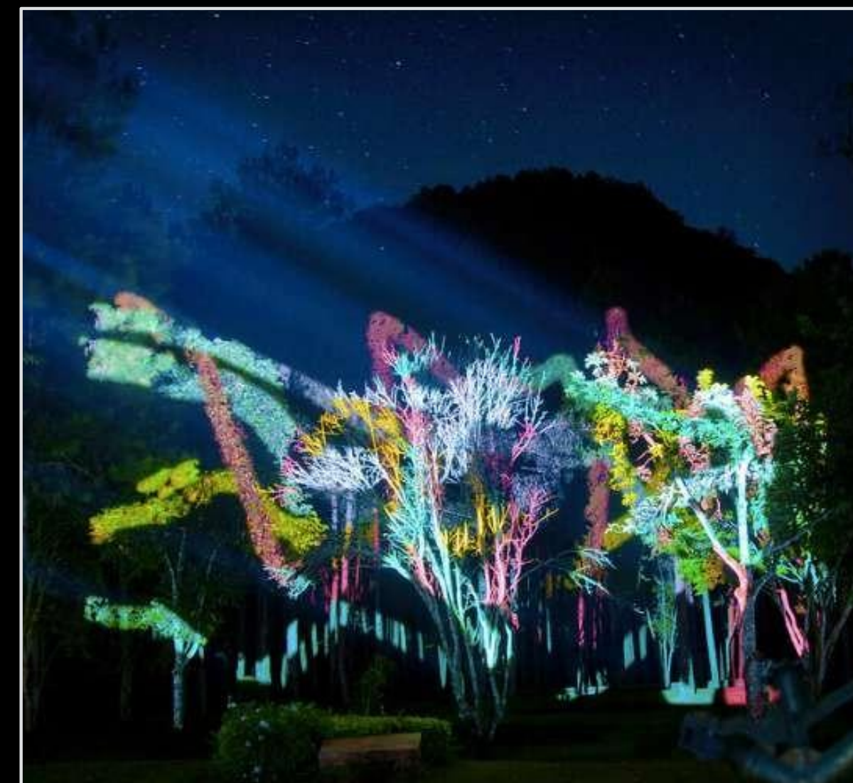
PROJEÇÃO NAS COPAS DAS ÁRVORES