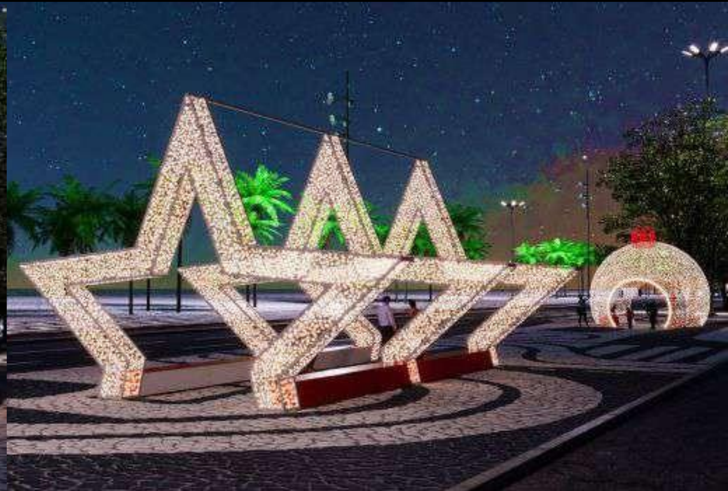
INSTALAÇÃO CENOGRÁFICA DE NATAL - PRAÇA RUI BARBOSA