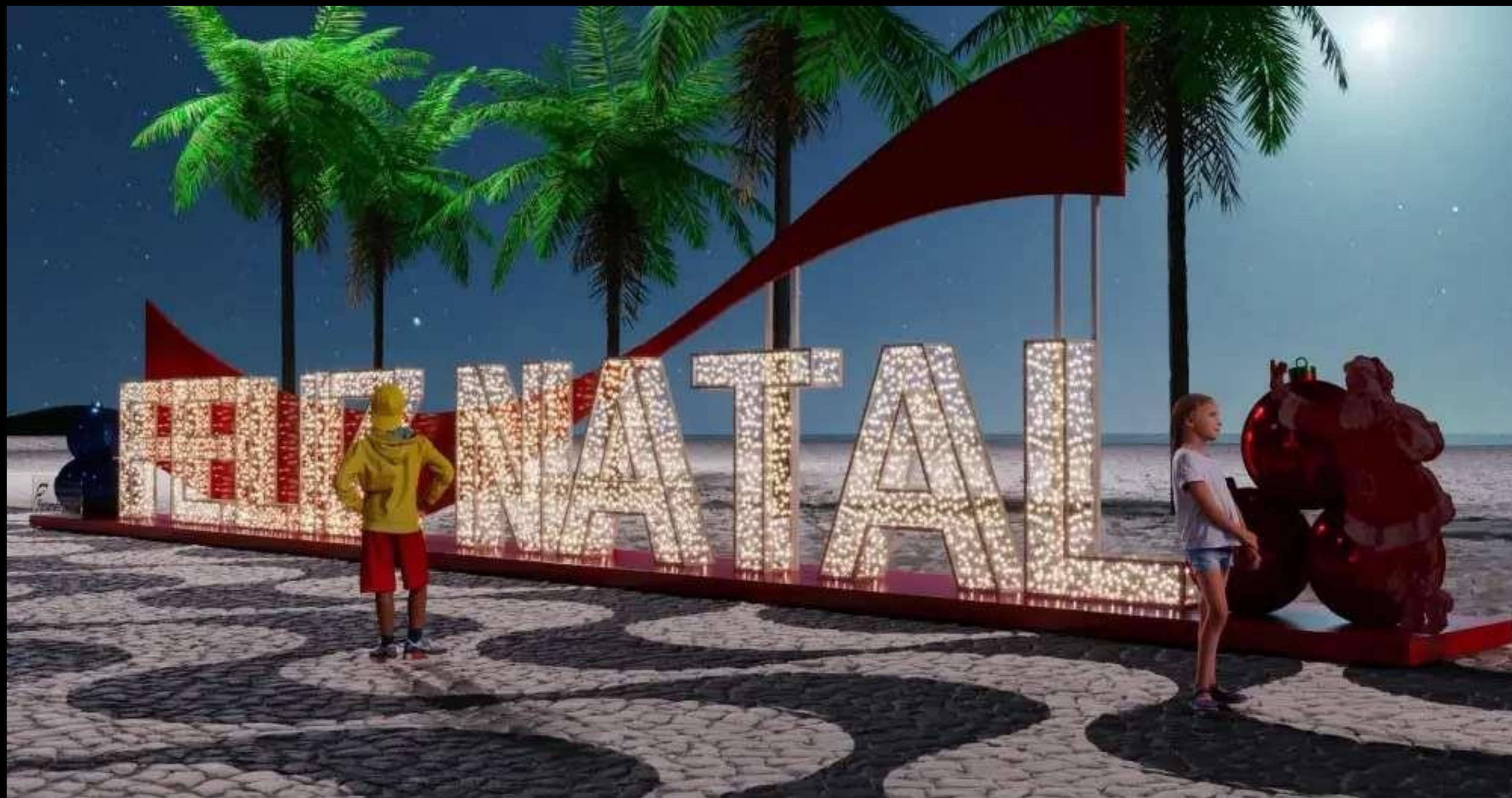
INSTALAÇÃO CENOGRÁFICA DE NATAL - PRAÇA RUI BARBOSA