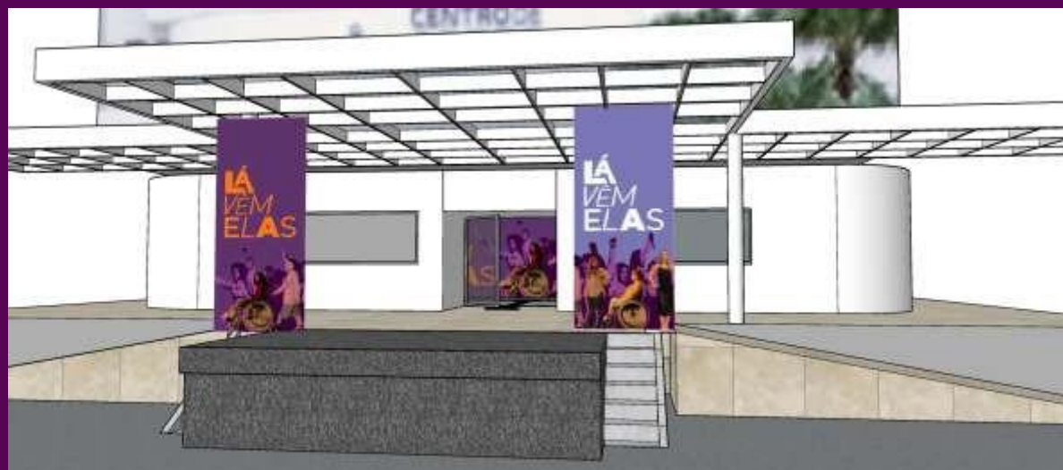
Palco evento lançamento