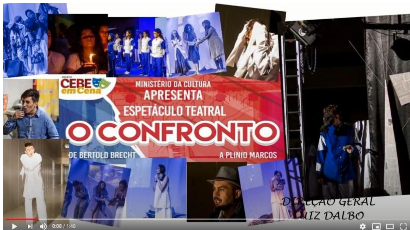
CEBE EM CENA